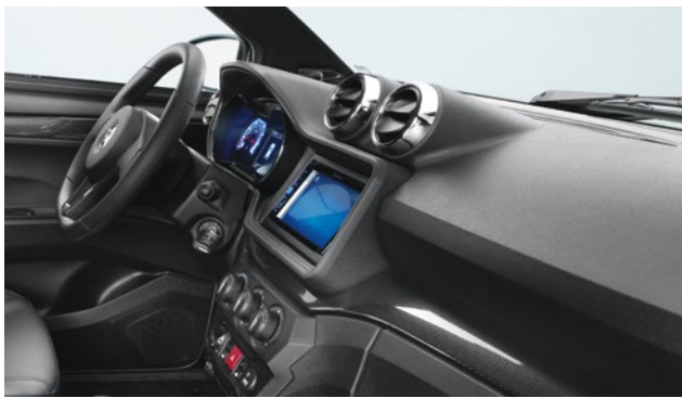
Cruscotto iniettato "Aixam cockpit" nero a grana fine.*