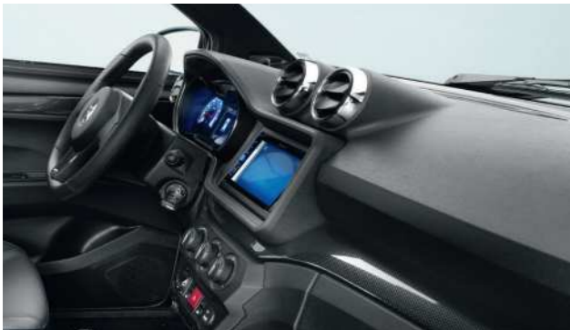
Cruscotto iniettato “Aixam cockpit” nero a grana fine.